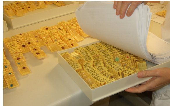
Blokker til snitting hoper seg opp.

Daværende prøveflyt: Røde lapper indikerer sløsing.