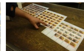
Bilde av artikkel gjør bestillingen raskere og fjerner språkbarrierer