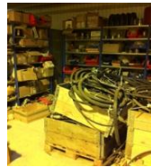
Uforsvarlig lagring av gamle deler