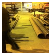
Mangelfull oversikt over materialer