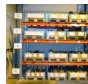
Full oversikt med lagerlokasjoner