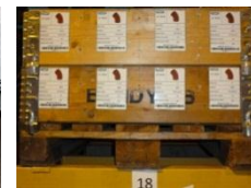
Tydelig definert og visuell standard for oppmerking