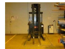
Definerte plasser for utstyr