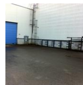
Mottaksplass for returvarer