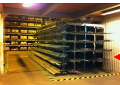
Forsvarlig og definert lagring