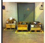
Ryddig og effektiv ekspedisjon