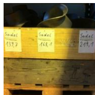
Mangelfull standard for oppmerkning.