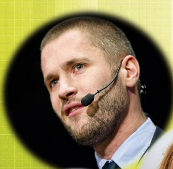
Niklas Modig Lean guru og inspirator